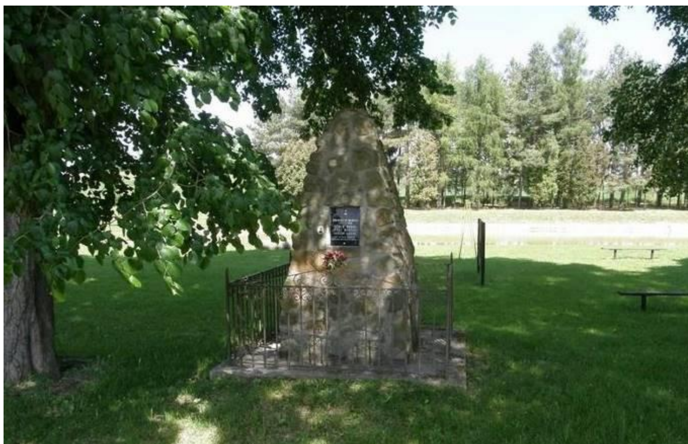
Nový Dvůr, při hlavní komunikaci, okres Nymburk.