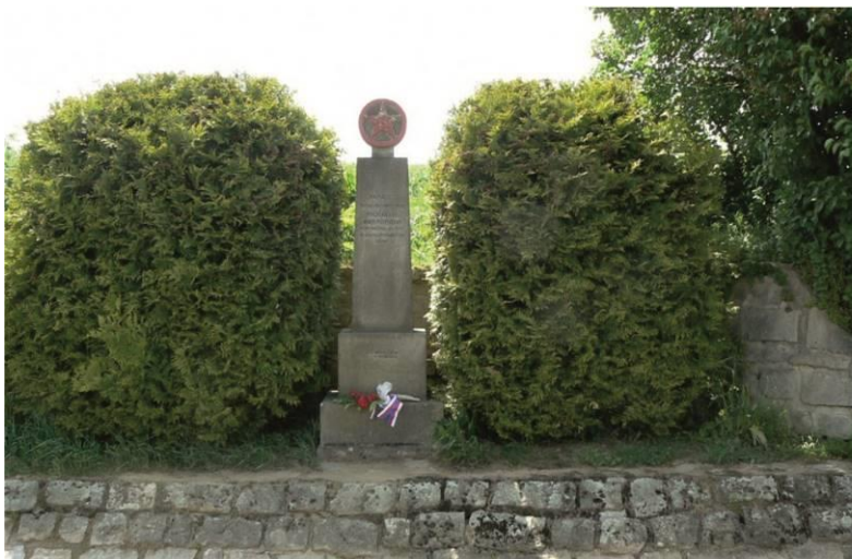
Pomník v Sedlejově