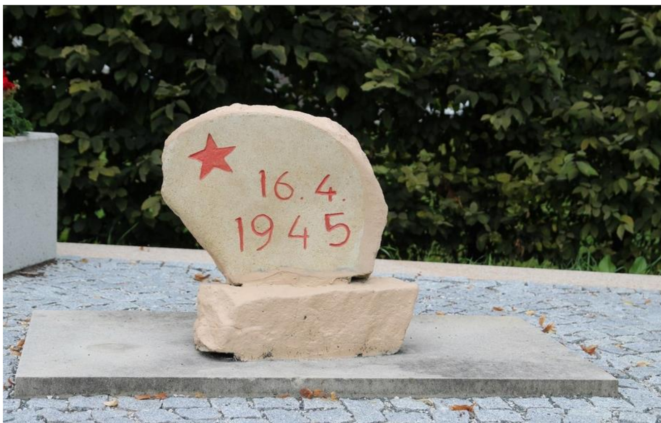
Hovorany, Hlavní, park naproti kostela. Autor: Brigita Petrášová.