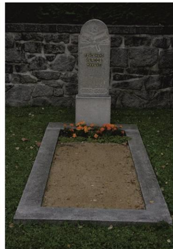
Hrob v Jihlavě

Od rodiny nás reakce moc potěšila. O tom pieta je.