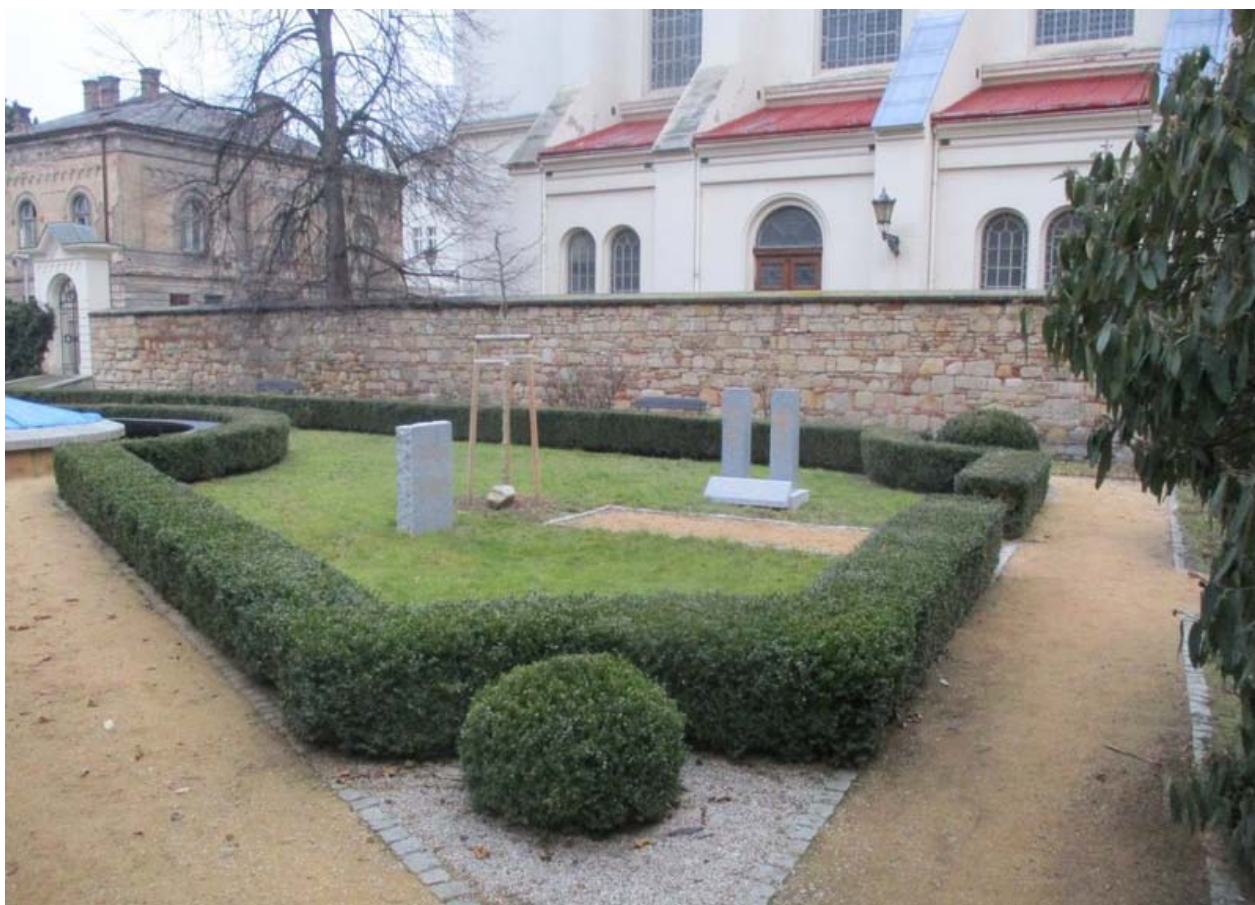
Plzeň - město, sady Pětatřicátníků 72/9, pomník je umístěn v Horníčkově zahradě