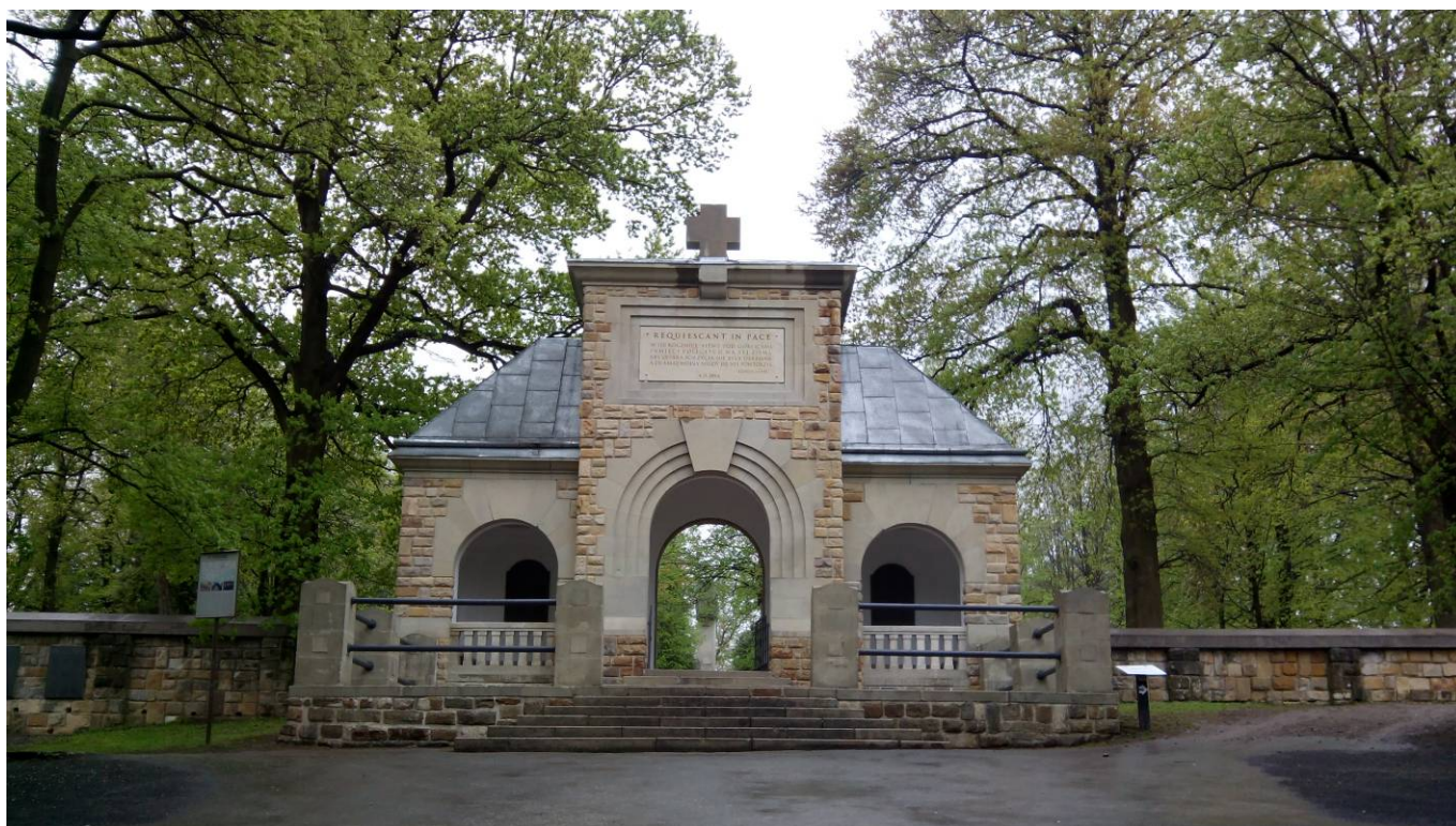
Gorlice - jeden ze prvoválečných hřbitovů v okolí města