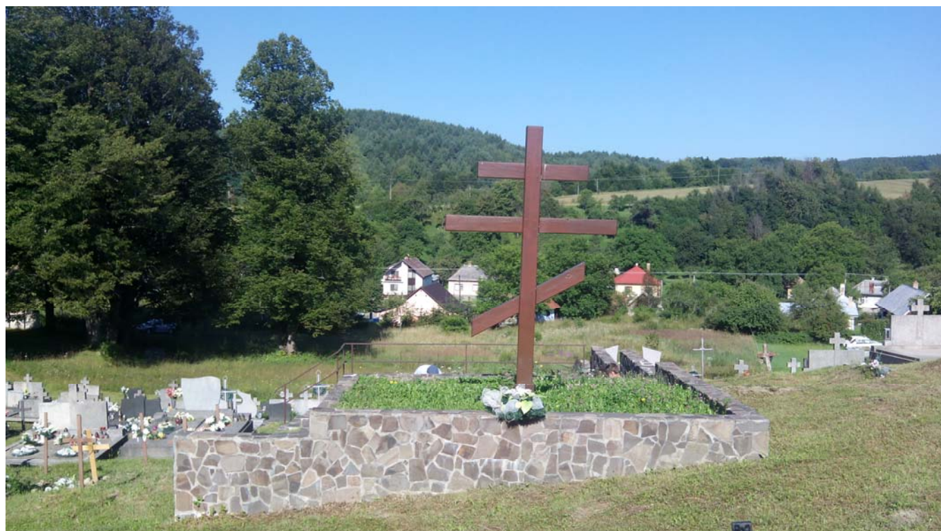
Osadné (Mezilaborce) hrob s ostatky těch co se do krypty nevešli, foto Petr Tichý