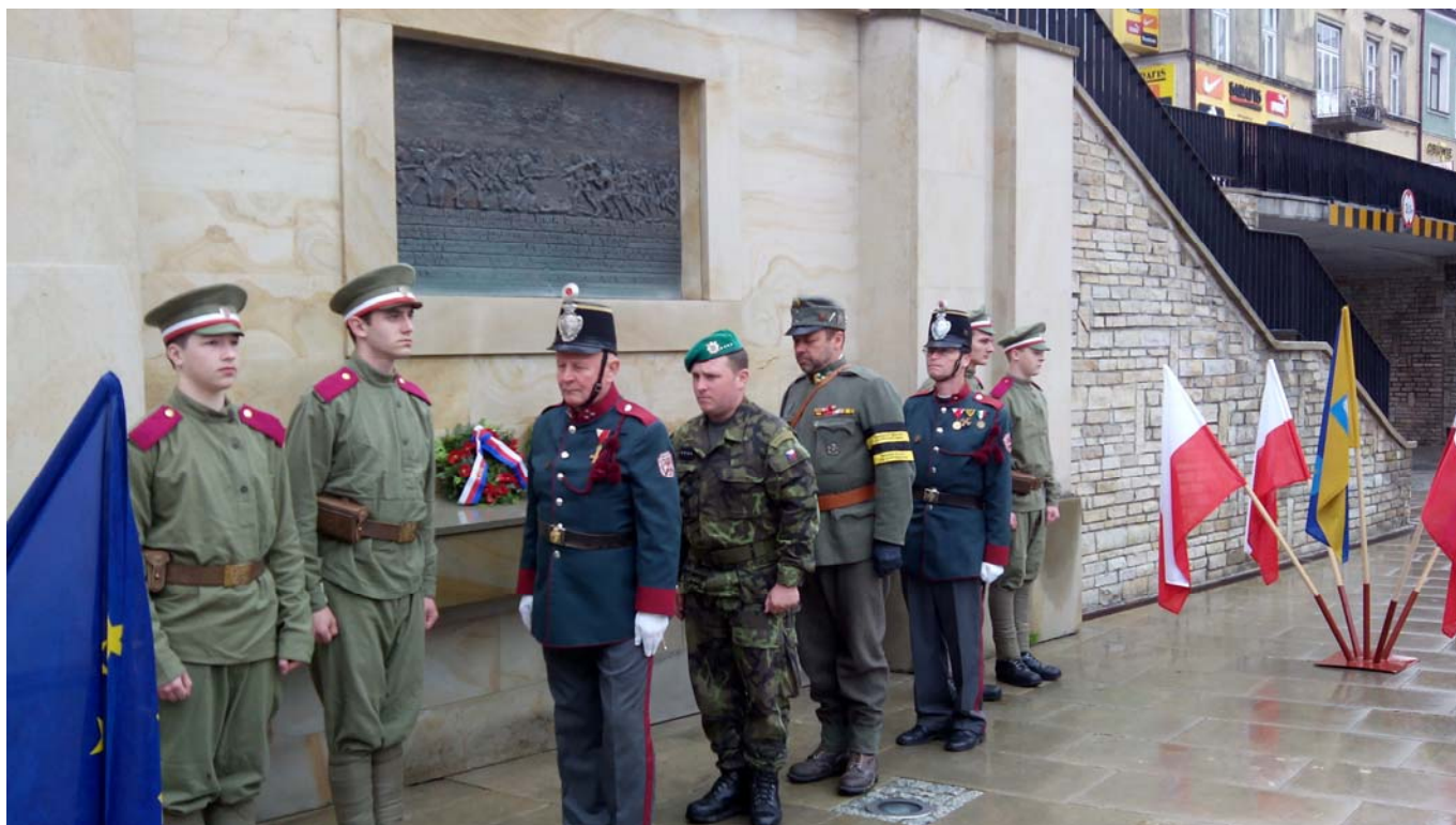
Gorlice Polsko