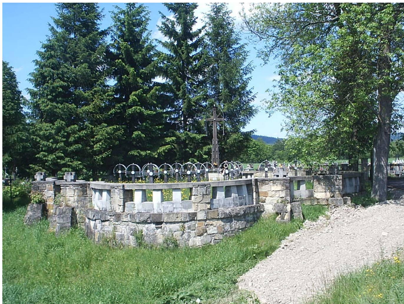
Cmentarz wojenny Nr. 56 PLR, pohřbeno množství Čechů