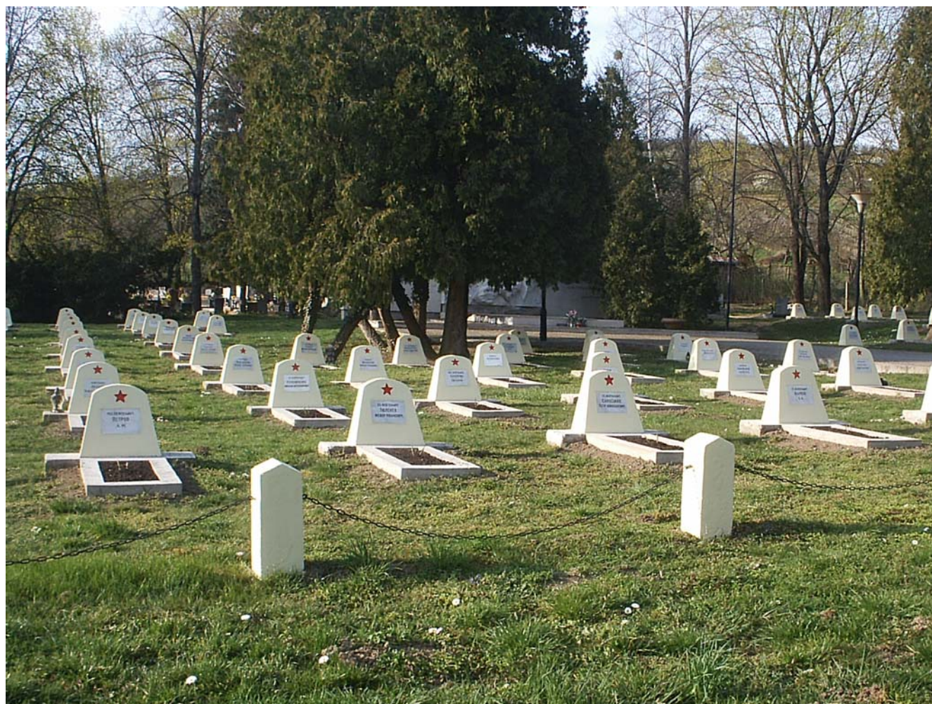
Hustopeče, vojenské pohřebiště RA