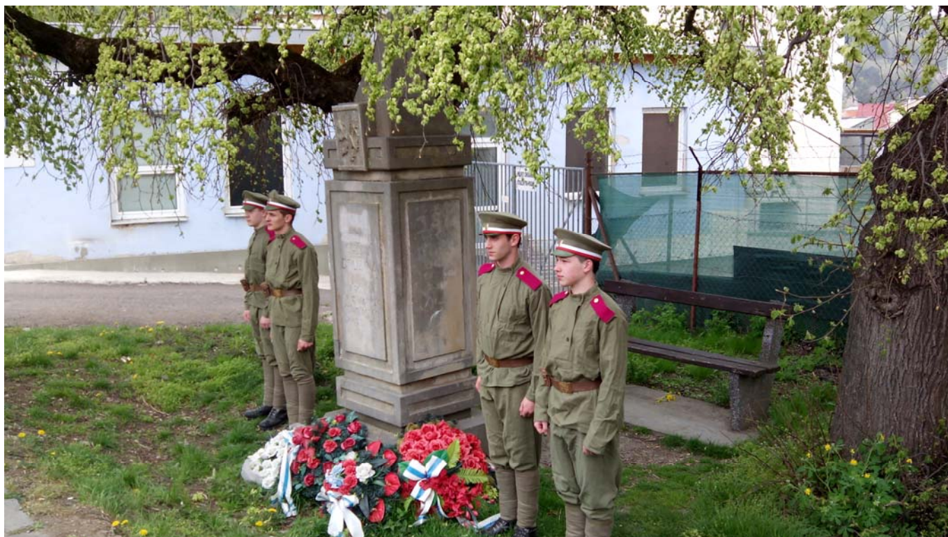
Medzilaborce - pomník České družiny