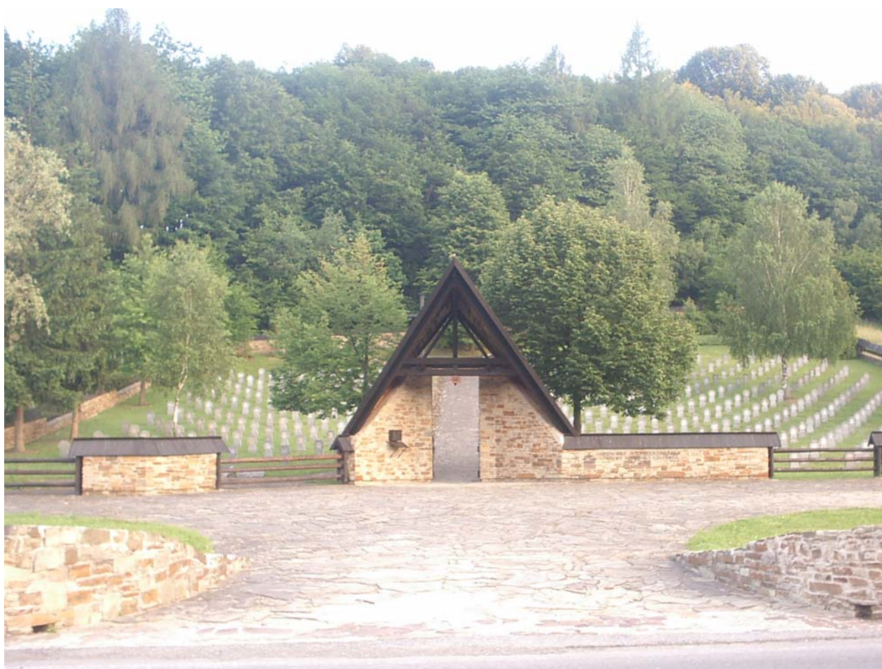
Hunkovce, jeden ze šesti německých druhoválečných hřbitovů na Slovensku