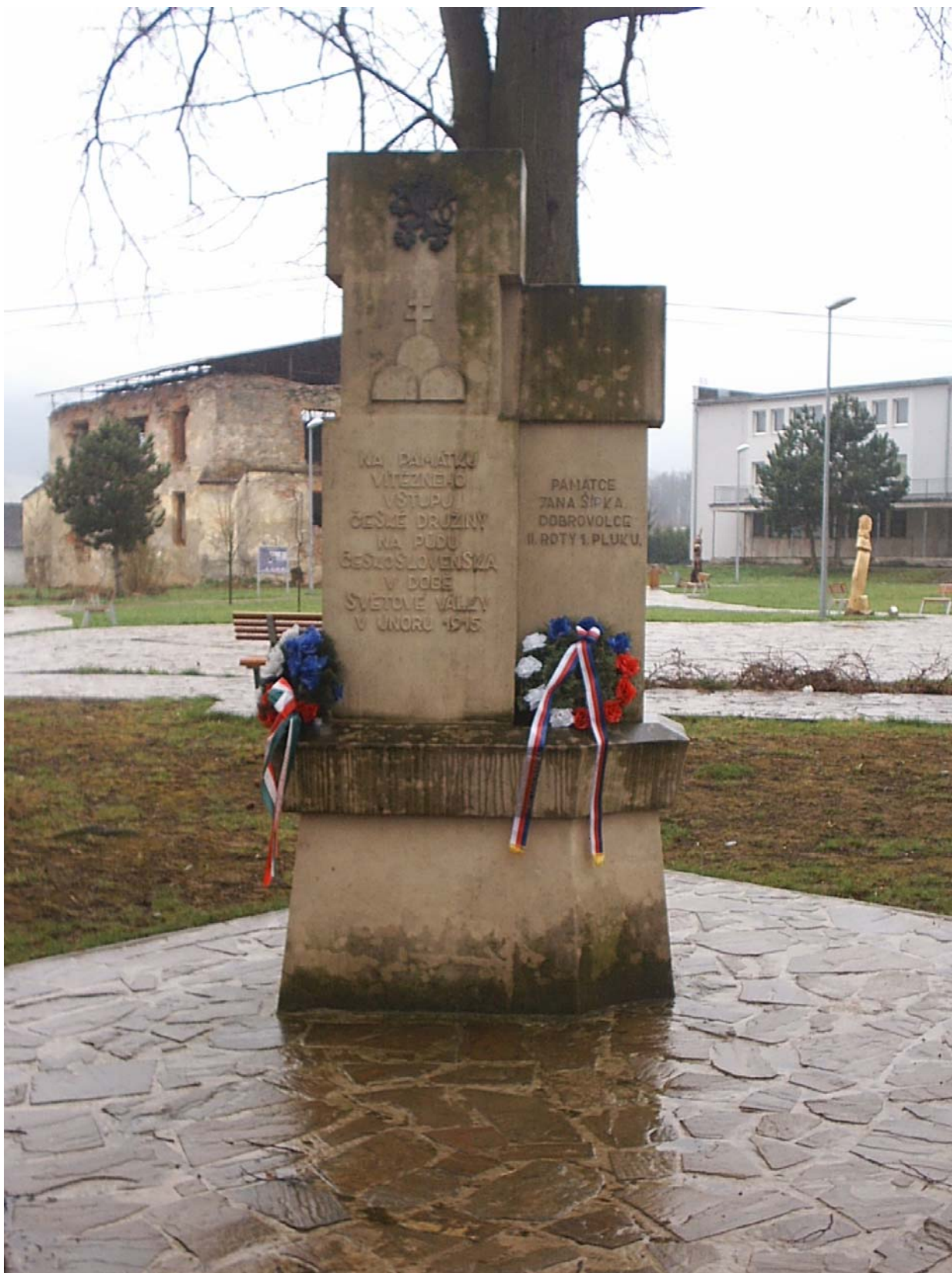
Zborov (slovenský) Šípkův pomník, výročí Velikonoční bitvy, zajetí 28. p.pl., první vystoupení České družiny.