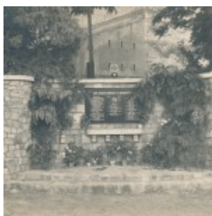
Pomník po 1. světové válce